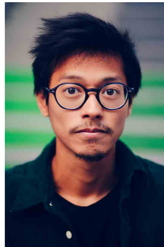
REUTTY SOK (il) Éditeur